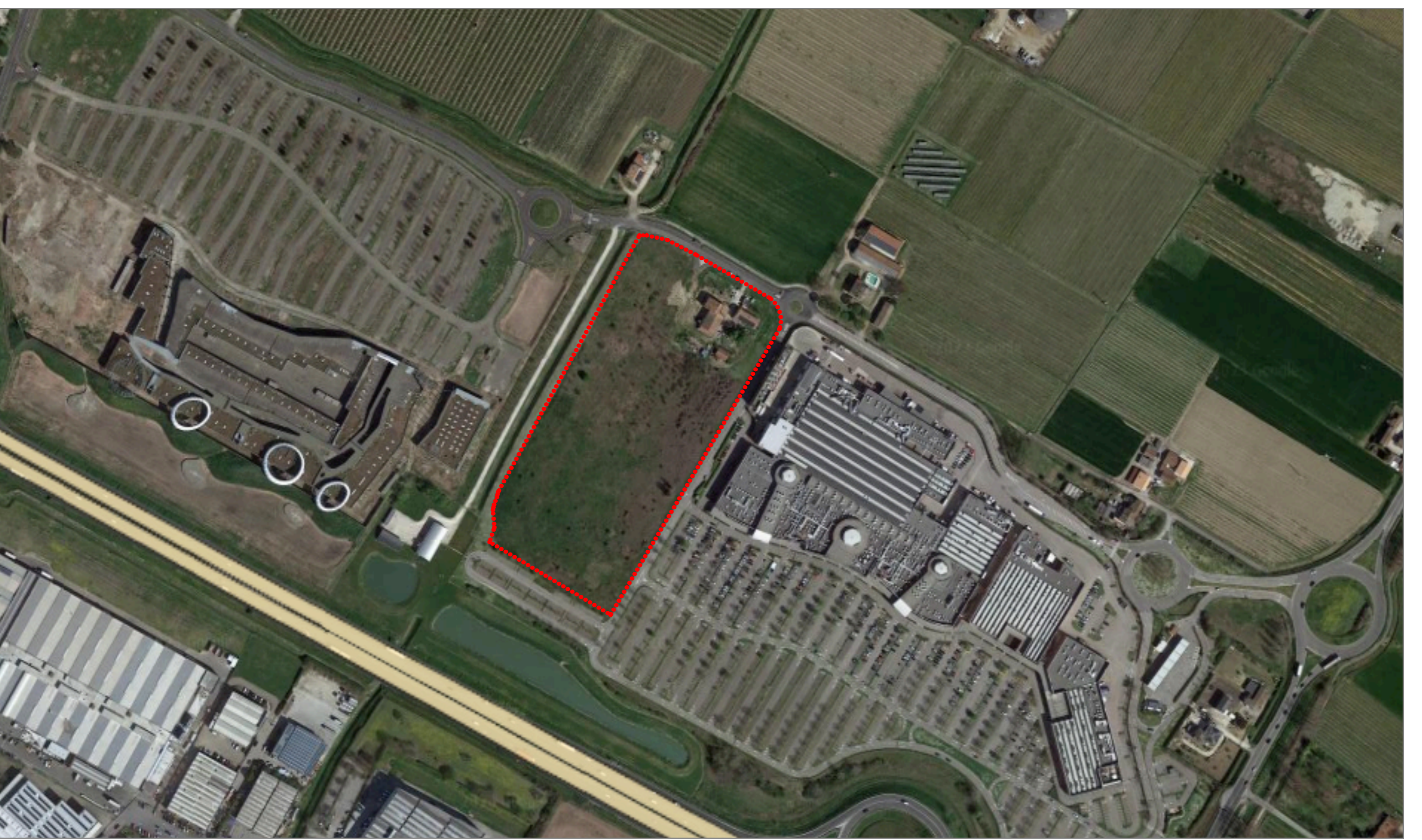
VISTA AEREA DELL'AREA OGGETTO DI INTERVENTO